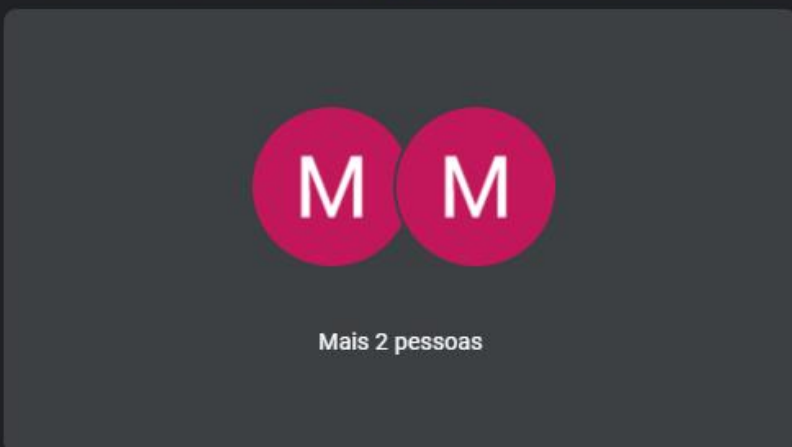
Mais 2 pessoas