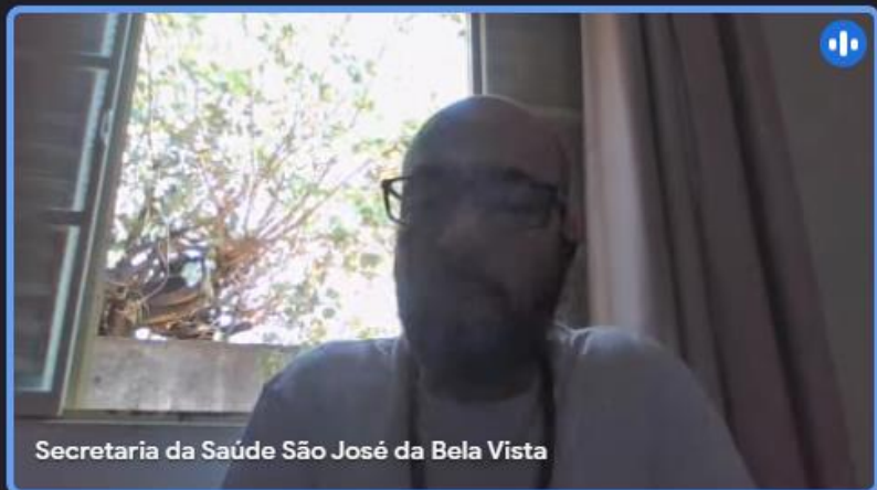
Secretaria da Saúde São José da Bela Vista